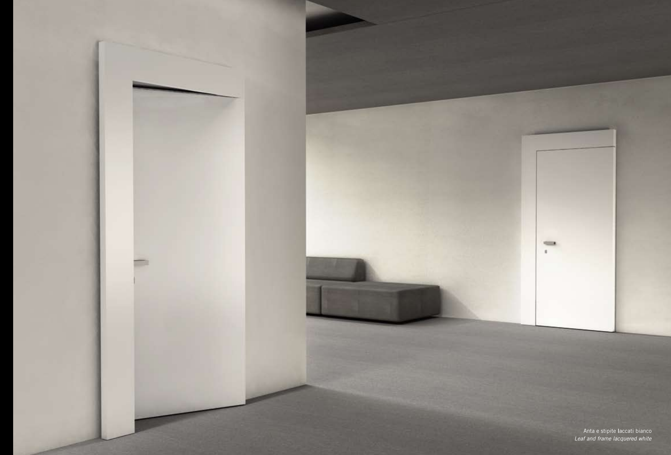
Anta e stipite laccati bianco Leaf and frame lacquered white