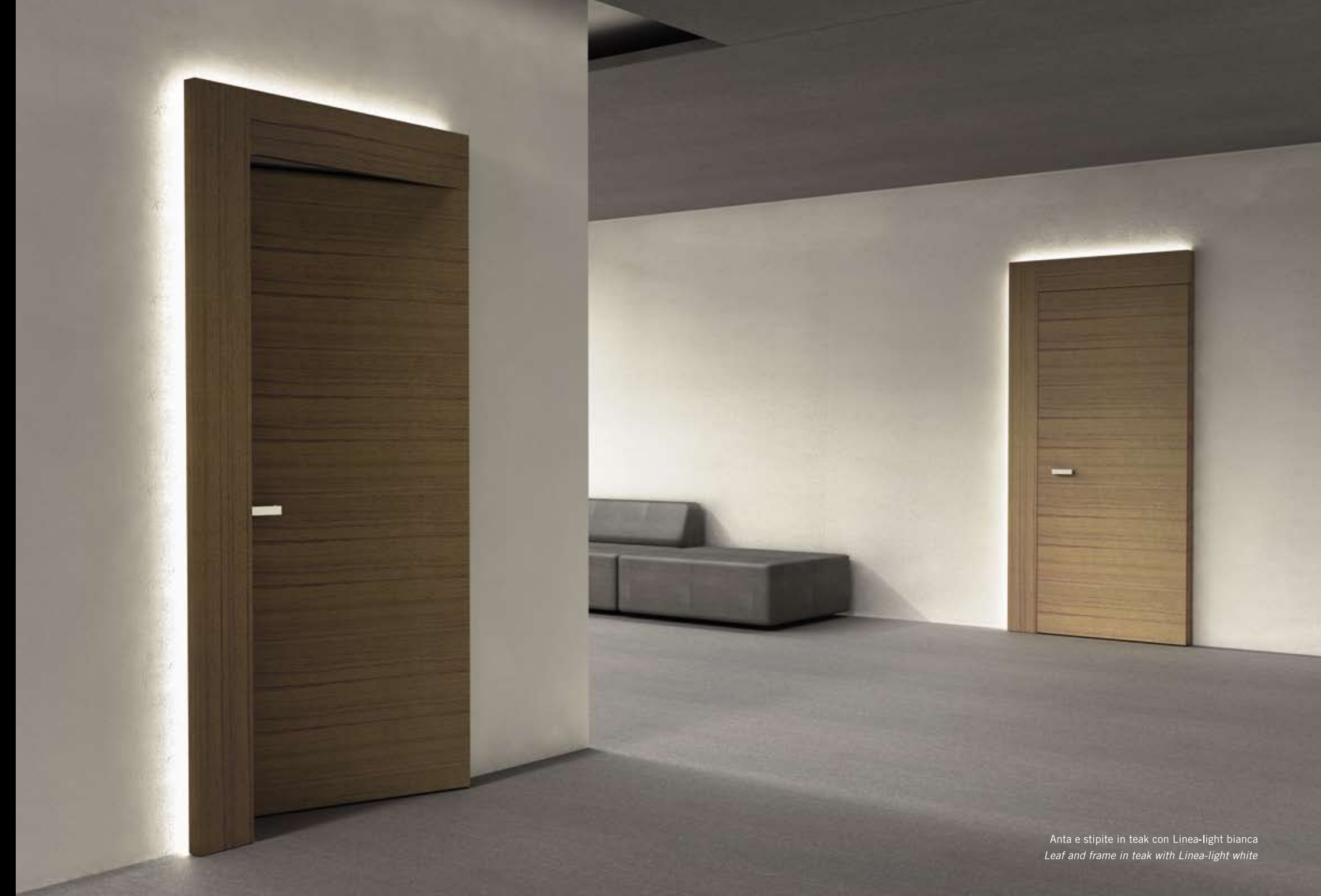
Anta e stipite in teak con Linea-light bianca Leaf and frame in teak with Linea-light white