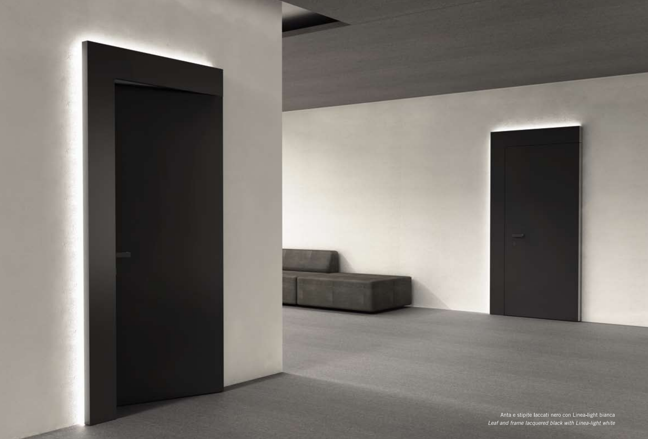
Anta e stipite laccati nero con Linea-light bianca Leaf and frame lacquered black with Linea-light white